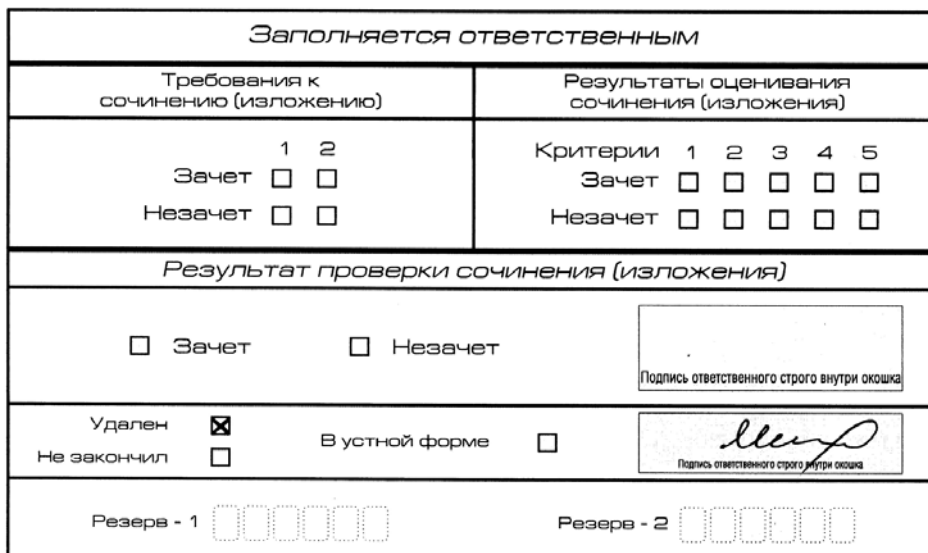
Рис. 13. Заполнение полей нижней части бланка регистрации (удаление с экзамена)